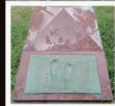
有森裕子選手の足型

毎年10月9日に氏子によって、新葉縄で大蛇(龍)を造り、頭を伊勢神宮方向に向けて鳥居に飾り、五穀豊穡を祈る風習が伝承されています。